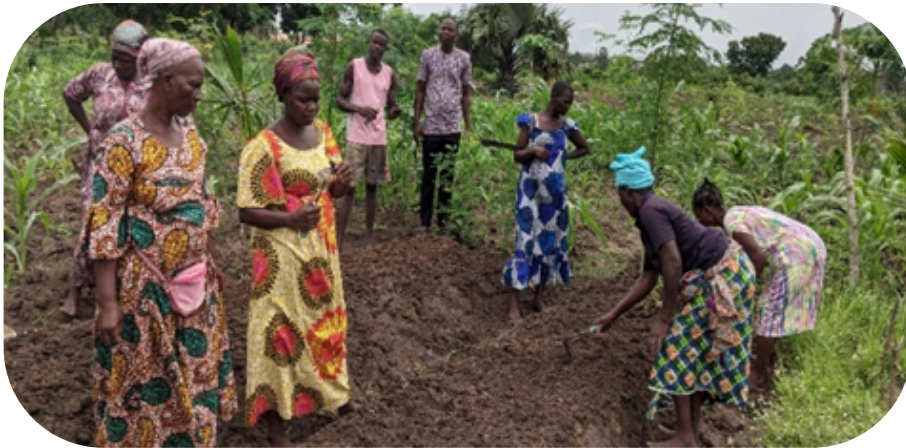
Figure 6 : Séances de travaux pratiques sur le site de Kpotavé