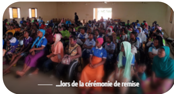
Figure 5 : La cérémonie de remise des jugements supplétifs aux apprentis