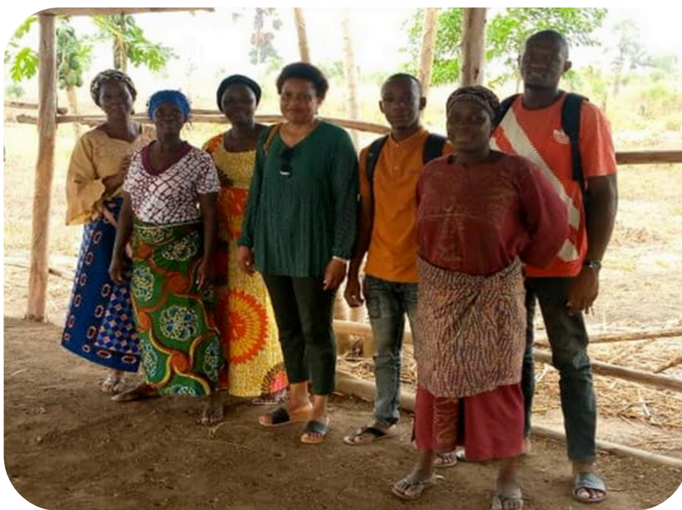
Figure 7 : La promotrice de INACET Togo (au milieu), les représentants de CI2D et quelques bénéficiaires sur le site de Kpotavé

En plus des éléments ci-dessus évoqués, des sessions de renforcement des capacités sur des producteurs sur les principes fondamentaux d'une société coopérative (les dispositions administratives, financières et les règles qui les régissent, la composition du bureau et les rôles des membres) ont également été tenues en collaboration avec INACET Togo à l'endroit de nos coopératives bénéficiaires.