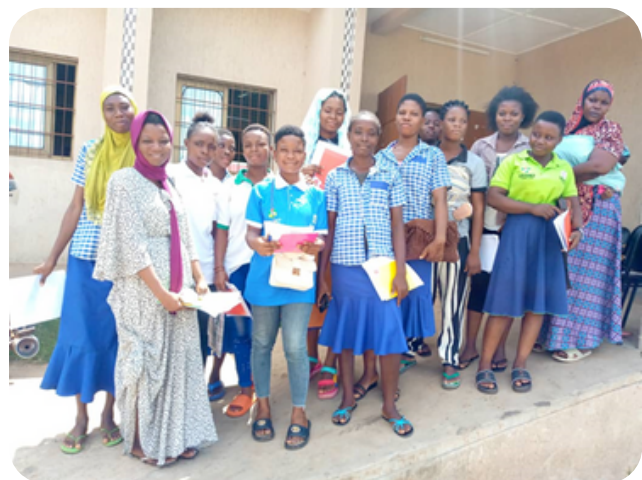
Figure 4 : Séances d'alphabétisation fonctionnelle avec des jeunes apprentis couturiers et coiffeurs