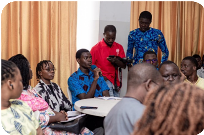
Figure 8 : Participation à l'atelier d'échanges et d'informations sur le sommet de l'avenir