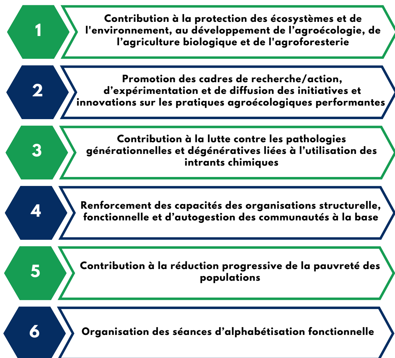
Figure 3 : Objectifs spécifiques d'intervention de CI2D

L'objectif général de l'association est de contribuer à l'amélioration des conditions de vie des populations en appuyant les efforts de développement par la recherche-action, la sensibilisation, la formation, le renforcement des capacités et des appuis matériels. Pour l'atteindre, CI2D mène les actions telles :